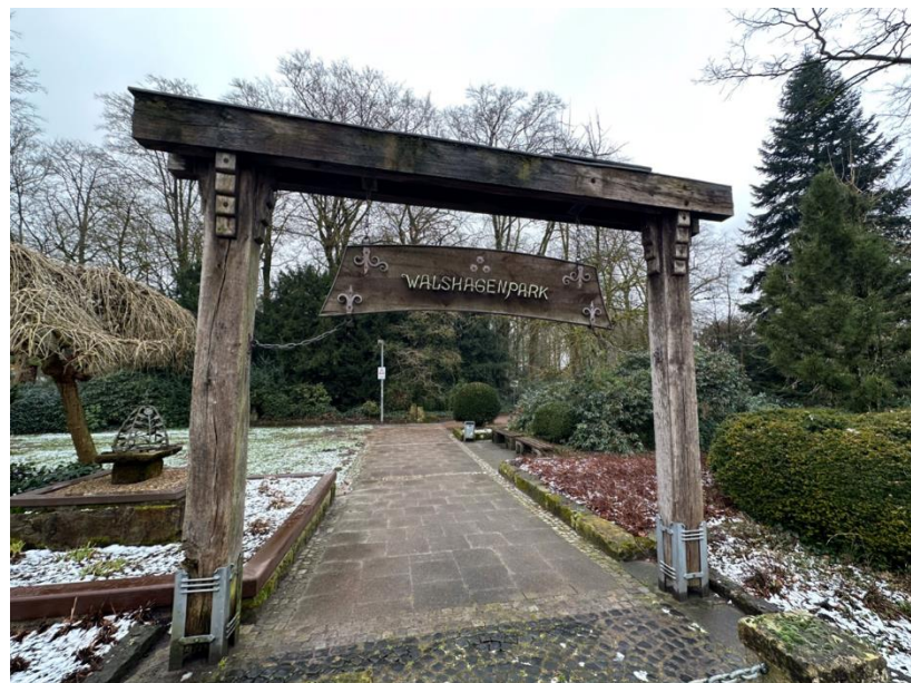
Abbildung 2: Eingangstor Walshagenpark

Der Walshagenpark übernimmt bereits heute zentrale Funktionen für Naherholung, Biodiversität sowie klimatische Ausgleichsprozesse. Gleichzeitig weist er funktionale, gestalterische und strukturelle Defizite sowie erhebliche Entwicklungspotenziale auf. Das Freiraumentwicklungskonzept beschreibt hierzu eine Gesamtvision, die insbesondere auf die Stärkung der ökologischen Qualitäten, die Verbesserung der Aufenthaltsqualität sowie die Vernetzung mit dem umliegenden Freiraumsystem und der Ems abzielt.